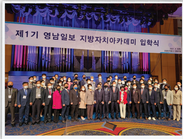
▲ 제1기 입학식