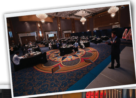
◀ 제1기 졸업식