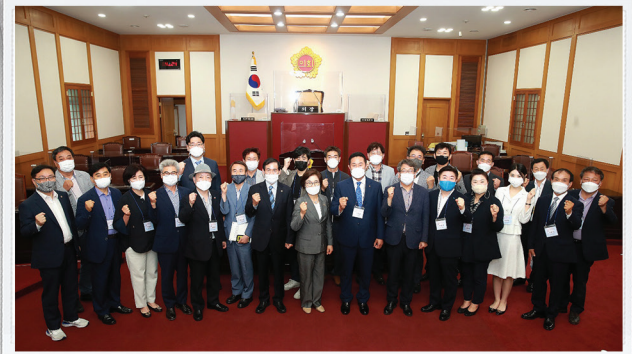
▲ 대구시의회 방문